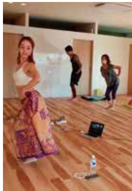
サトリのタヒチ&ヨガ