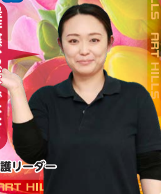
舞田介護リーダー

【ことばの散歩道】 若い時の私の母は、いつも身だしなみの良い人で、つい真似をしているのだと想います。私も何より先に身仕度をすませてから家事をして居りました。