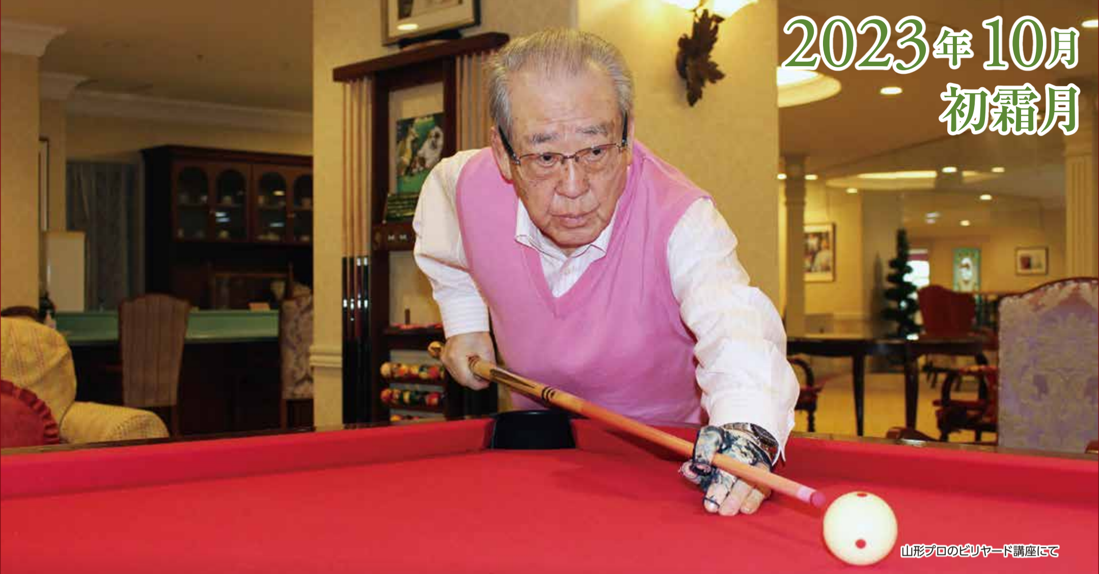
山形プロのビリヤード講座にて