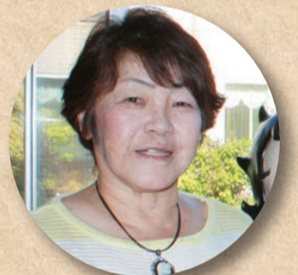
長崎ケアワーカー

今年も残り3か月となりました。 10月は朝晩の寒暖差が大きくなります。 体調を崩さないようお過ごしください。 今月のイベントは、12日に大好評のサックス&ソング、 28日はハロウィン歌合戦を予定しています。 ハロウィン歌合戦では、職員の衣装もお楽しみください。 皆様からのご意見・ご要望をお待ちしております。