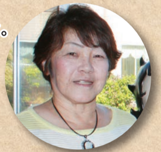
長崎ケアワーカー

9月19日は敬老の日ですね。 今年の敬老祭は、10日と17日を予定しております。 皆様のご健康と長寿を願い、職員一同お祝いをさせていただきます。 式典後は、斉藤航様のヴァイオリンコンサートをお楽しみください。 気温差も大きくなり、上着を持って出かけるなど体調管理に気を付けてお過ごし下さい。 皆様からのご意見・ご要望をお待ちしております。