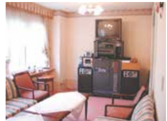
コミュニティールーム (カラオケを完備)