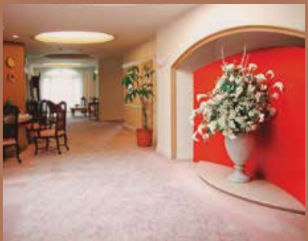
1F エントランスホール