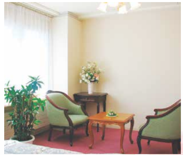
居室 (個室のほか、夫婦など)