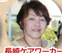
長崎ケアワーカー