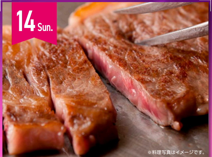
※料理写真はイメージです。